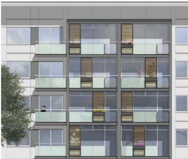
(skitse af renoveret altanfacade)

Køreplanen er nu, at der efter endelig godkendelse hos kommunen og Landsbyggefonden foretages EU udbud af teknikeropgaven. Det valgte teknikerteam udarbejder detailprojekt og forestår udbud. Efter at have fundet den billigste entreprenør til at udføre opgaven, skal der ske en endelig godkendelse fra kommunen, og først herefter kan byggearbejderne opstartes, så selv om afdelingsmødet nu har godkendt projektomfang, forventer vi først at byggearbejderne opstartes ultimo 2007.