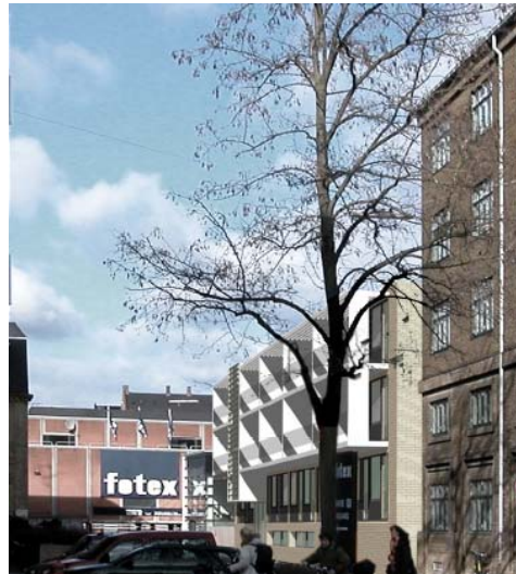
(Computeranimation af byggeriet)

Afdelingen ligger tæt ved Metro-stationen på Falkoner Allé.