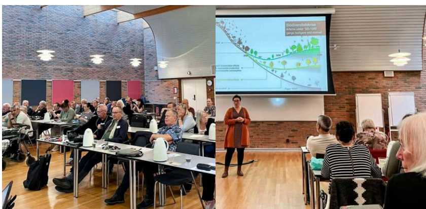
Konference for afdelingsbestyrelser d. 30. september til d. 1. oktober 2022 på Pharmakon i Hillerød.

Den årlige konference for alle afdelingsbestyrelsesmedlemmer løb af stablen d. 30. september til 1. oktober 2022 på Pharmakon i Hillerød. Temaet for første dag var frivilliges motivation og samarbejde. På andendagen var temaet bæredygtigt byggeri og biodiversitet.