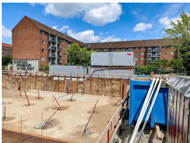
Foto fra byggepladsen på Sundholmsvej 59 på Amager, hvor den kommende afdeling Astatas Have kommer til at ligge.

Vi vil i organisationsbestyrelsen nøje følge implementeringen af den nye lovgivning og fortsat arbejde for, at der i VIBO kan opføres nye boliger – enten ved deltagelse i konkurrencer, ved at indgå aftaler inden for rammerne af en delegeret bygherremodel, eller alternativt ved at undersøge mulighederne for fortætning.