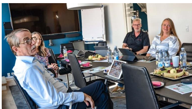
Møde i Uddannelse og Boligsocialt udvalg

VIBOs bestyrelse følger situationen tæt og vil fortsat bakke op om indsatsen for de afdelinger, som får støtte til det boligsociale arbejde fra Landsbyggefonden.