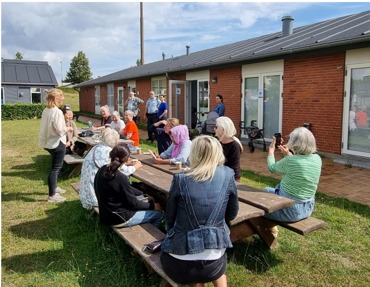
Kaffehygge i Stamhuset med Nivå-Kokkedal På Vej.

Denne model blev vedtaget på et ekstraordinært afdelingsmøde i afd. 106 i juni 2022 og blev godkendt af Københavns Kommune i august 2022 med formel opstart samme måned. Da afdelingen sammen med Bo-Vitas afdeling var en del af regeringens liste over ghettoområder pr. 1. december 2021 blev Landsbyggefondens økonomiske bevilling til afdelingen på samme niveau, som den tidligere har været.