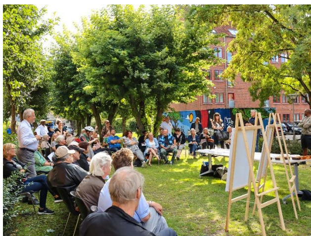
Beboermøde i forbindelse med den fysiske helhedsplan i afd. 127, Runddelen I & II på Nørrebro.

I forbindelse med opfølgning på de boligsociale helhedsplaner er VIBO repræsenteret i de boligsociale bestyrelser i København, Frederiksberg, Fredensborg og Høje-Taastrup og samarbejder herudover med Frederiksberg Kommune og de boligorganisationer, der har afdelinger på Frederiksberg, om den boligsociale indsats på Frederiksberg.