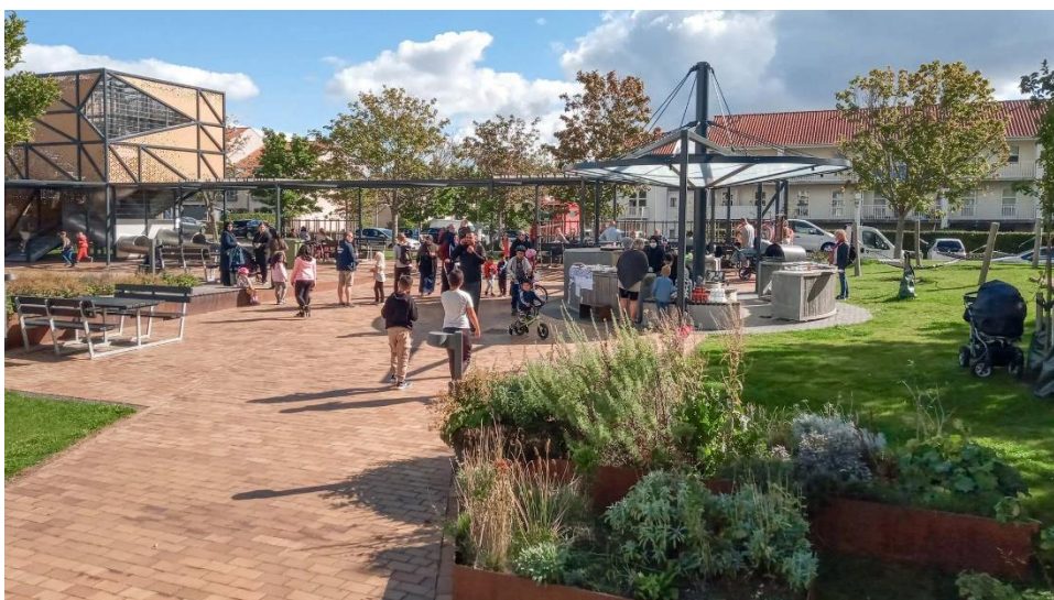
Aktivitetsdag i den nye boligsociale helhedsplan Nivå-Kokkedal på Vej.