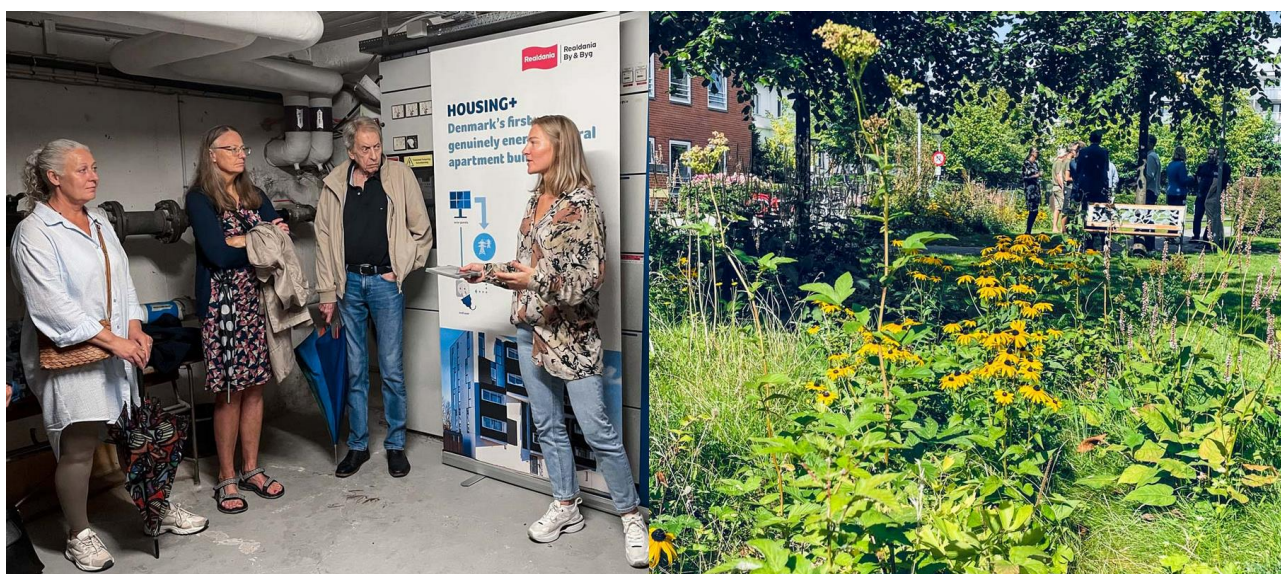
Ekskursion d. 27. august 2022 med fokus på solcelleanlæg og -batterier samt biodiversitet.