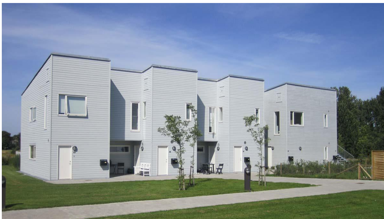
Afd. 212, Bavne Ager i Gilleleje.

Baggrunden var, at 1.400 almene boliger ikke kunne opføres grundet stigende priser på materialer og håndværkere.